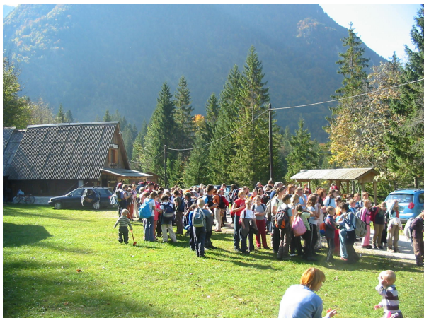
Daljši počitek v kampu Lazar

Srečanje smo začeli v kampu Klin v Lepeni, dobili papirnate listke z različnimi živalmi in se po soški poti mimo vasi Soča podali ob reki Soči do kampa Lazar v Trenti, kjer so nam organizatorji pripravili topel napitek in rogljičke. Tu smo naredili daljši počitek.