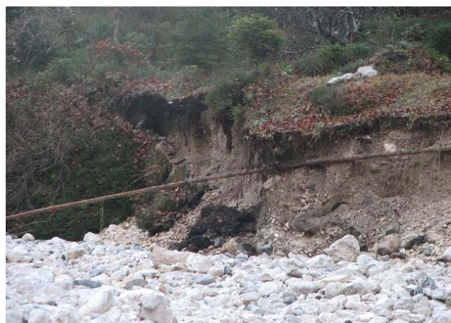
fotografije stanja 3.11.2008