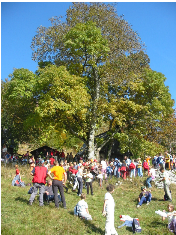
Skupaj zbrani na Lemovju

Na Lemovju smo naredili daljši počitek, kjer smo uprizorili klepet živali (živali napisane na papirnatih listkih, ki smo jih prejeli na začetku srečanja v kampu Klin) z namenom, da vasico oz. zaselek prebudimo iz tišine.