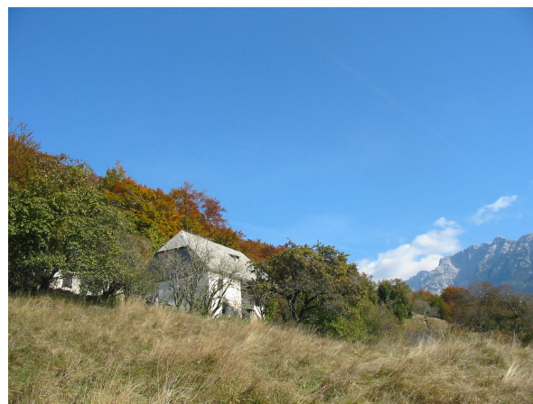
Še stoječa hiša v zaselku Lemovje

Zapuščena vasica Lemovje je od vasi Soča oddaljena 45 minut hoje po planinski poti, ki vodi proti Bavškemu Grintavcu. V vasi ni več stalnih prebivalcev, a je vredna ogleda, saj je postavljena na slikovit plato pobočja Grintavca. Zapuščene kmetije sledijo značilni lokalni arhitekturi, opuščeni travniki so obdani s kamnitimi zidovi ali miri, ki so v dolini že redkost.