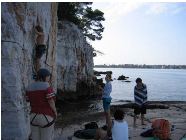
V skali navsezgodaj zjutraj, drugega dne.

je, v začetku septembra, odpravilo sedem plezalcev in plezalk (ne copat :)). Prvi dan je bil namenjen samo plezanju, medtem ko smo se drugi dan bolj kot plezanju posvetili poležavanju, sončenju in seveda plavanju. Izkupiček obeh dni je bil tako na koncu kar spoštljiv, če upoštevamo, da smo spali od petka do nedelje le dobrih 6h. Splezali smo 3 smeri z oceno 6c, 2. z oceno 6b, 2. z oceno 6a, ter 10 smeri z oceno od 4b do 5c. Ker to potepanje postaja vedno bolj zanimivo in številčno se ne bojim, da nas v letu 2006 ne bo na Hrvaško. Kvečjemu se lahko zgodi, da se nas odpravi cel avtobus. Sam to pomeni že preveč poznanih fac na kupu. Potem pa zmanjka ljudi s katerimi bi se lahko pobratili. Saj veste kako je to morje, plaže, sonce, ženske (za ženske pa tipi) in tako naprej.