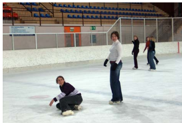
No, no tudi načelnici se lahko ponesreči in pade.

No, pa smo ga dočakali. Naš prvi izlet z MO namreč! Za prvi tak izlet smo se odločili, da se odpeljemo na Bled, ki je bil v tem zimskem času še posebej čaroben. Tam smo preizkusili svoje drsalne in tudi »padalske« sposobnosti (o tem