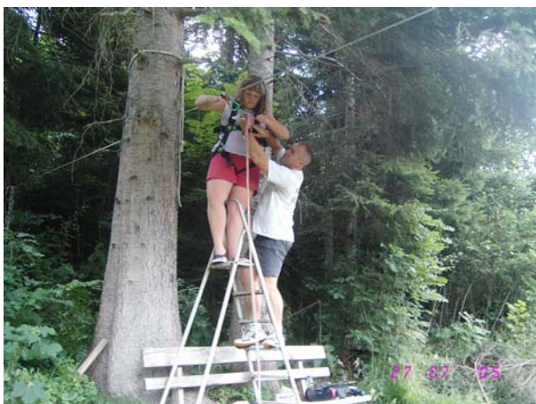
Priprave na sam spust.