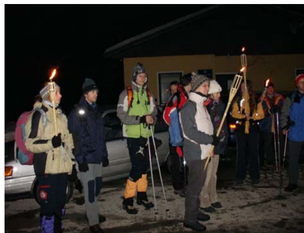
Nočni pohod na Sv. Ano.

udeležencev je v koči čakal vroč čaj, za katerega pa ni bilo potrebno seči v žep. Čakala nas je še polovica poti, v dolino. Malenkost smo šli po drugi poti, da je bilo bolj pestro in da smo se izognili morebitnim padcem na ledeni stezi.