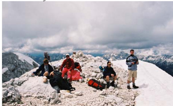
Vsi zadihani in utrujeni na vrhu Kanjavca.

Kanjavec je bila ena izmed mnogih tur, ki smo jih izvedli skupaj s prijatelji iz MO Ajdovščina. Kot vedno se je ideja za turo porodila dan prej. In ker vsi skupaj ne kompliciramo preveč, smo v soboto zjutraj že bili v dolini Zadnjice. Počasi smo sopihali proti Zasavski koči na Prehodavcih. Ko smo prišli k koči smo videli, da ima vrh malo več snega kot smo pričakovali. A hvala bogu smo bili skoraj na vse pripravljeni. Zato nam tudi malo snega ni preprečilo prihoda na vrh. Na vrhu smo se naužili prekrasnega razgleda na delno pobeljene Julijce in se nato spustili na Dolič. To ti je bil spust, malo smo se drsali, malo spotikali in malo gazili. Ma kaj čmo, je treba izkoristiti še zadnji sneg. Ko smo zapustili kočjo na Doliču smo se odpravili na dolgo in naporno pot v Zadnjico. In povem vam le še to, da ga ni čez mrzlo vodo in sezute škornje.