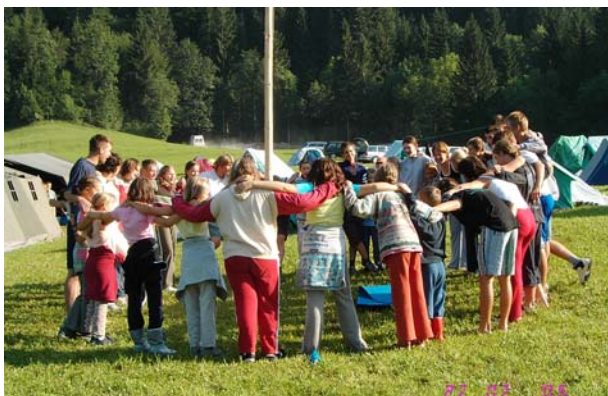
Jutranji pozdrav soncu.

Končno sva s prijateljico z enodnevno zamudo prispeli v prekrasno logarsko dolino. Skozi ves teden smo imeli zelo lepo vreme. Imeli smo več izletov v gore, najbolj zahteven je bil dvodnevi izlet na Korošico. Izleti v gore zahtevajo kar precej energije in vztrajnosti. A te nam ni manjkalo...Energijo pa smo pridobivali s hrano. Ko smo se z gora vračali v tabor, nas je vedno najbolj razveselil vonj iz kuhinje. Hrana je bila zelo dobra.